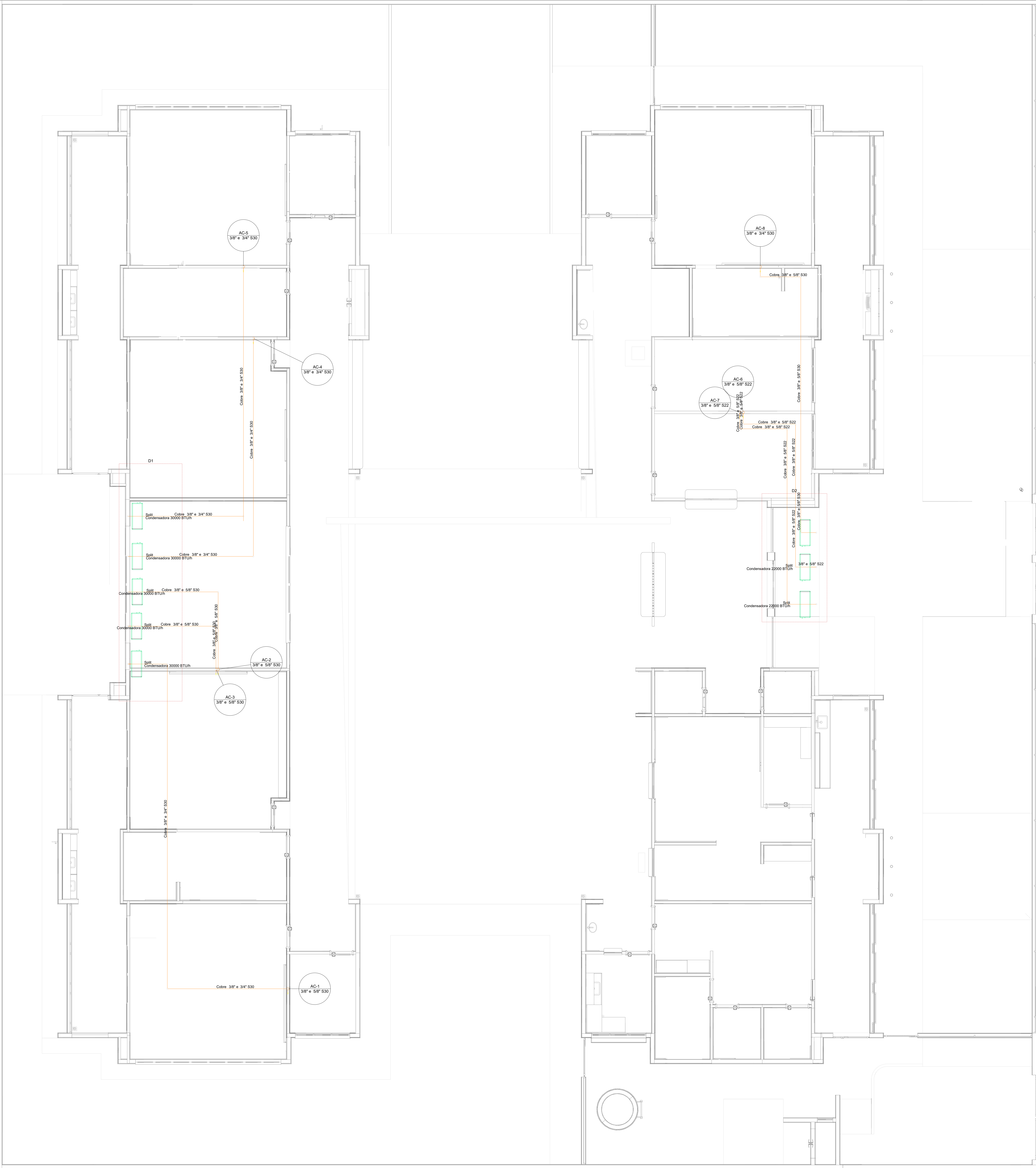
3 PLANTA BAIXA COBERTURA ESCALA 1/50